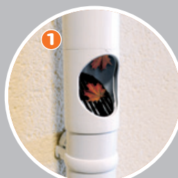
Piège à feuilles

Relier la descente de gouttière à la cuve ou 2 cuves entre elles