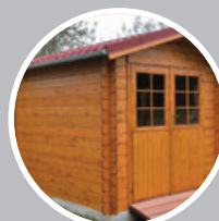
Abri de jardin