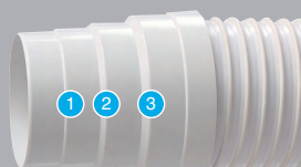
Pipe 540 mm